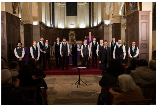
Les spectateurs ovationnent le Chœur d'Hommes des Ombres

Comme annoncé dans la dernière lettre d'information, un projet concret a été mis sur pied ces dernières semaines. Travaillé avec l'AIC (Association Internationale des Charités) de Fianarantsoa, réorienté, il a maintenant bien mûri pour faire appel aux subventions. Nous souhaitons maintenant vous le présenter et en discuter lors d'un prochain échange. Cela sera donc l'objet de notre Assemblée Générale à laquelle nous vous invitons : le 29 mai 2016 à 17 h à Cachan.